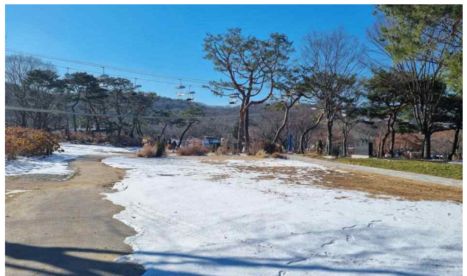
2024 서울대공원 시민정원 공모 예정지(테마가든 내-사정상 변경될 수 있음)