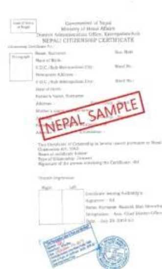
<尼泊尔家族关系证明书公证件>

大使馆学位证明认证书 Verification of diploma from Korean Embassy