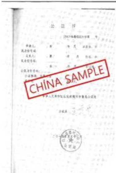
<中国亲属关系证明公证书>

出生证明和家族关系证明 (如果原件不是英文则需要附加翻译件) Birth certificate