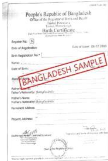
<孟加拉国出生证明书>