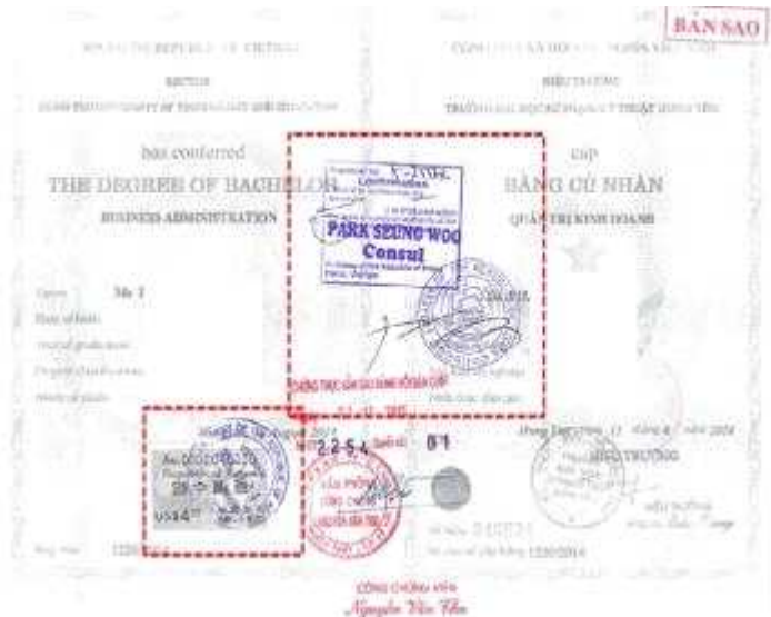
<越南学位证书大使馆认证>