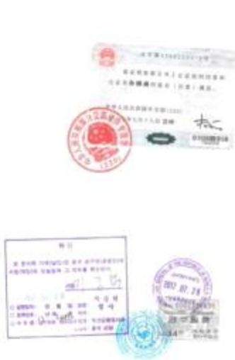
<中国学位证公证件大使馆认证>

大使馆学位证明认证书 Verification of diploma from Korean Embassy