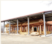
야외 실습장 I