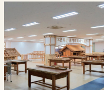
실내 실습장 II