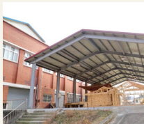
야외 실습장 II