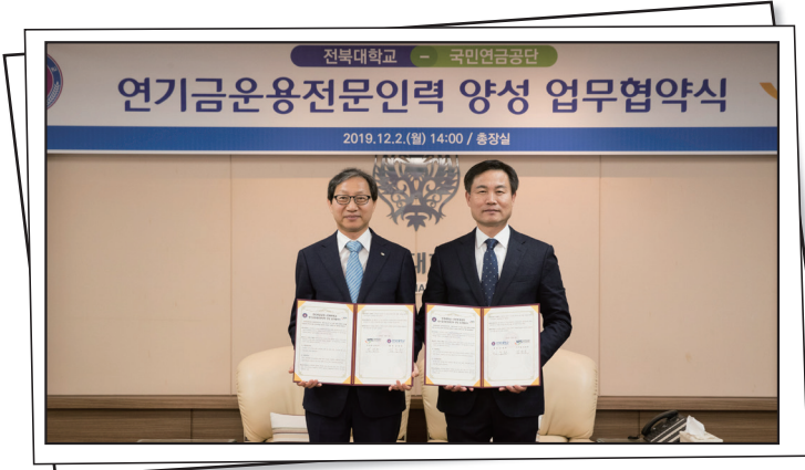
2019년 국민연금공단 MOU 체결