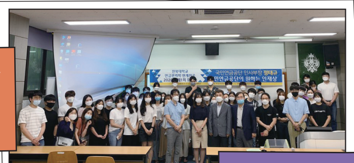
AFPK 교육기관 지정