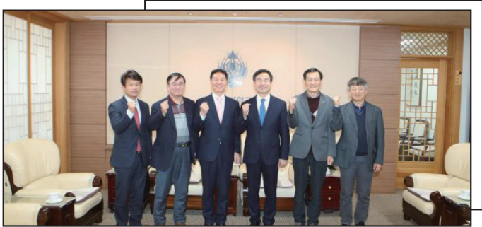
2020년 사학연금 공단 MOU 체결