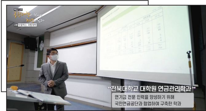
EBS 특집다큐 방영 - 지역연계 우수사례 -