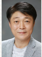
연출 오진욱 교수