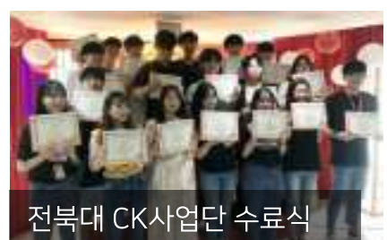
전북대 CK사업단 수료식