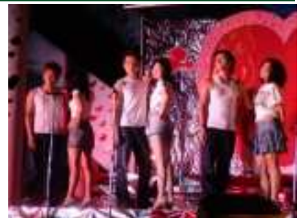
크리스마스, 할로윈, 개교기념일, 발렌타인 데이 등 다양한 학내 액티비티