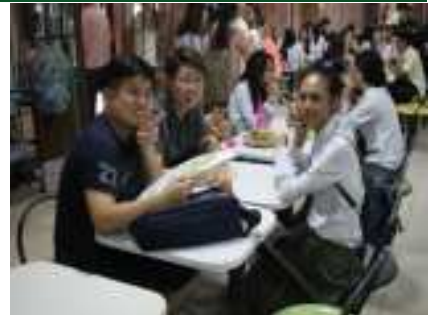
산호세대학교 학생 1명과 파견학생 2~3명 버디 매칭