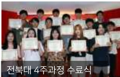
전북대 4주과정 수료식