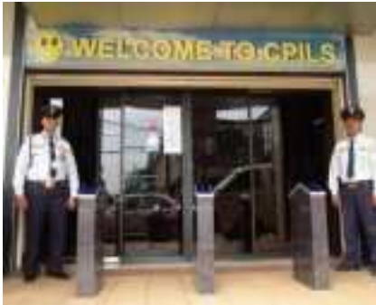
출입구 - 24시간 경비