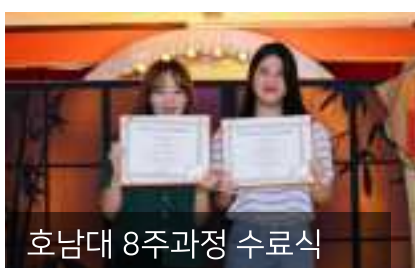
호남대 8주과정 수료식