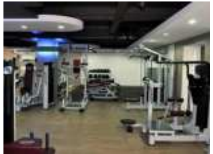
필리핀 최고의 시설을 자랑하는 헬스장 (트레이너 상주)