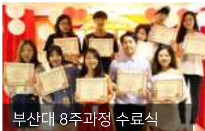
부산대 8주과정 수료식