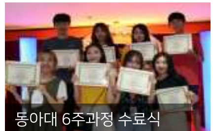
동아대 6주과정 수료식