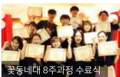
꽃동네대 8주과정 수료식