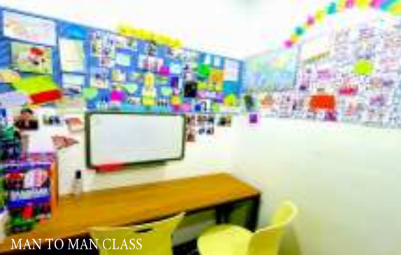
MAN TO MAN CLASS