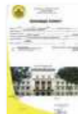
BUSINESS PERMIT (Permit No. 121615)