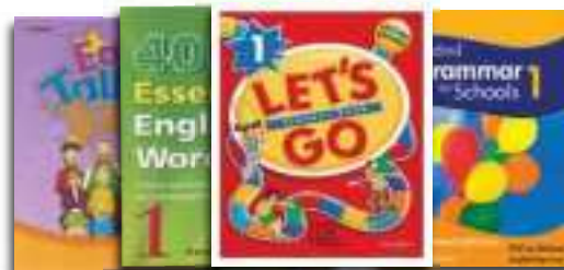
Junior ESL Book