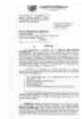
SSP & VISA (AAFS No. SMB-2013-005)