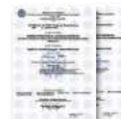
TESDA (NTR No. 201907220060)