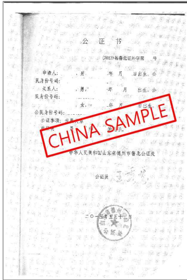
<中国家族关系证明公证本>