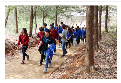
4월 전북대학교 캠퍼스 둘레길 탐방