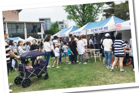
5월 어린이날 부스 운영