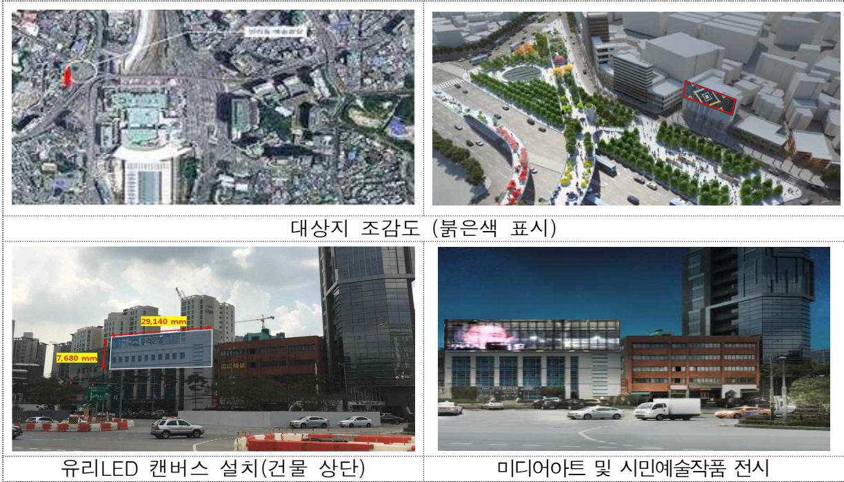
대상지 조감도 (붉은색 표시)