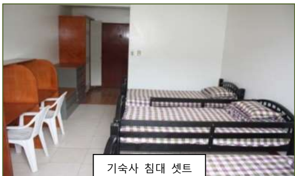
기숙사 침대 셋트