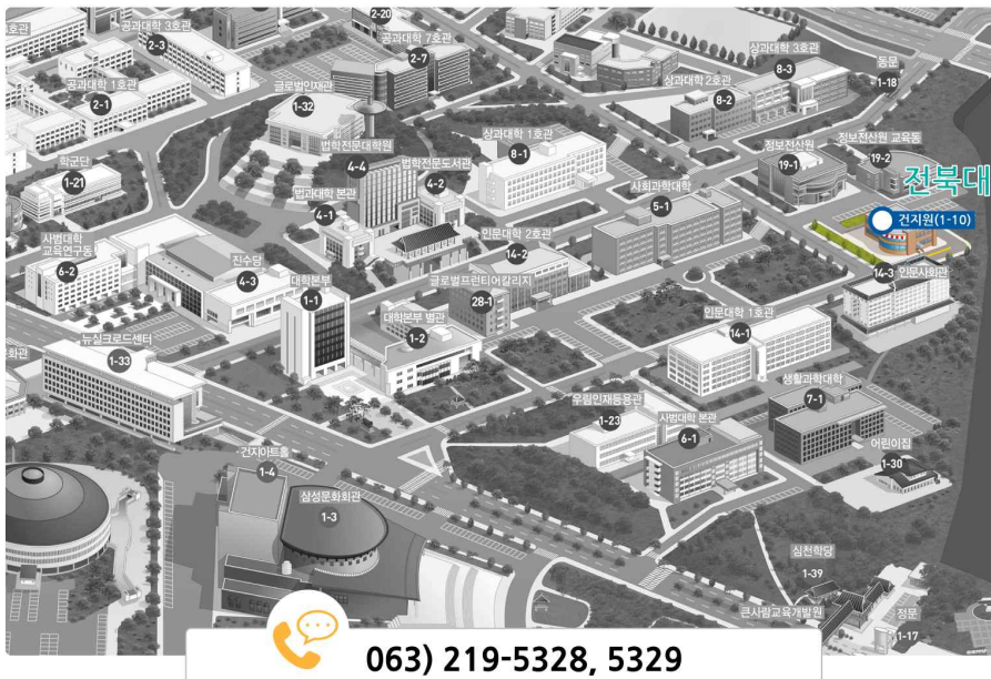
전북대학교 산학연구본부 현장실습지원센터