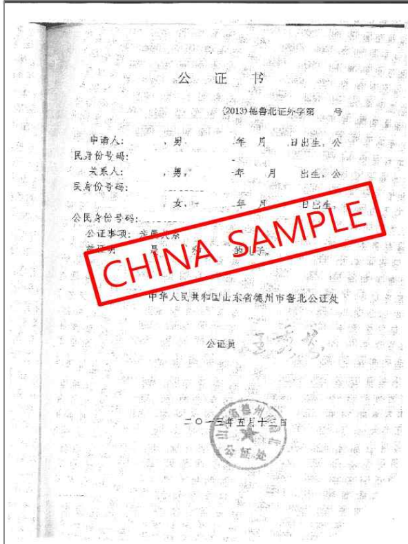
<중국 친족관계증명서 공증본>

출생증명서 또는 가족관계증명서(영어나 한국어가 아닌 경우 번역문 필요) Birth certificate