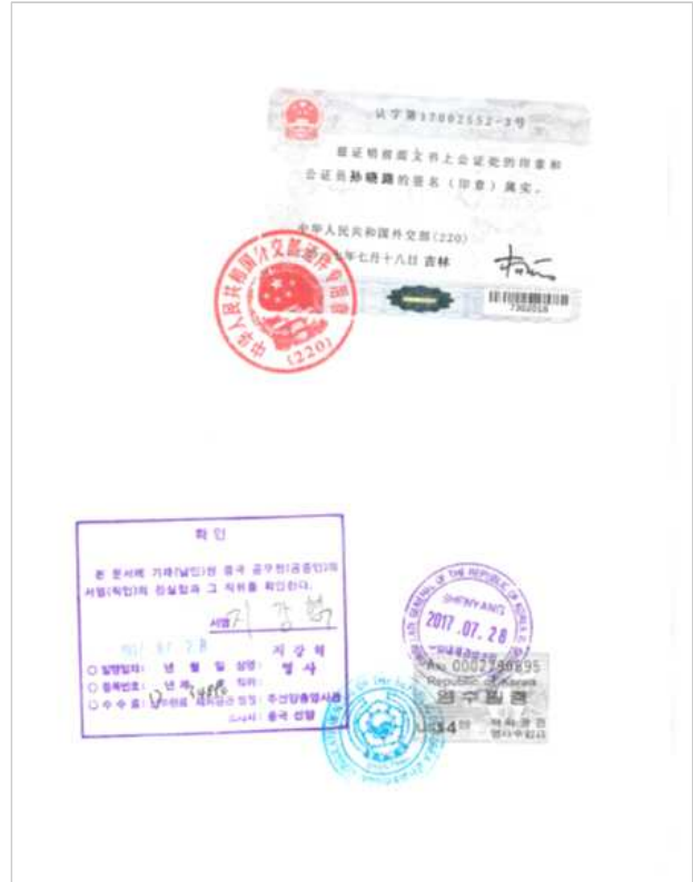
<중국 학위증서 공증본 대사관인증>