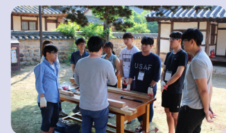
대패체험-한옥 공구사용 체험