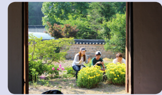
숨은액자를 찾아라-조별 사진촬영