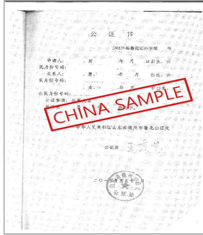
<중국 친족관계증명서 공증본>