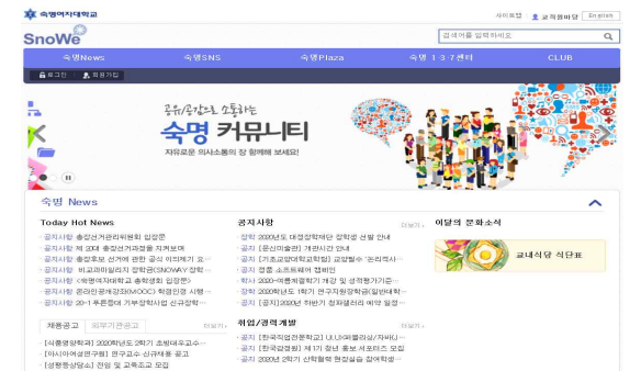
SnoWe(커뮤니티) 각종 공지사항을 확인할 수 있는 곳