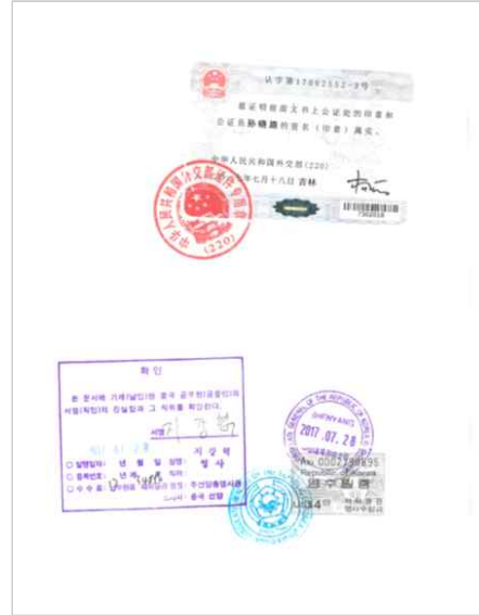
<중국 학위증서 공증본 대사관인증>