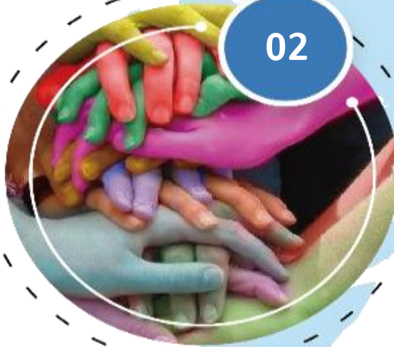
개최지 강남구의 브랜드 이미지화