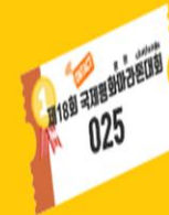
추첨 상품권 (총 200만원 상당)

영상 완주자 특별 혜택 (영상완주자는 영상 송출 완료 완주자로 대회 시작 10시부터 폐막식 14:30까지 중 영상 송출을 유지한 영상 참가자)