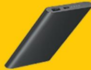
보조배터리(Full / Half 신청자)