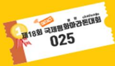
경품추첨권 (냉장고/세탁기 등)