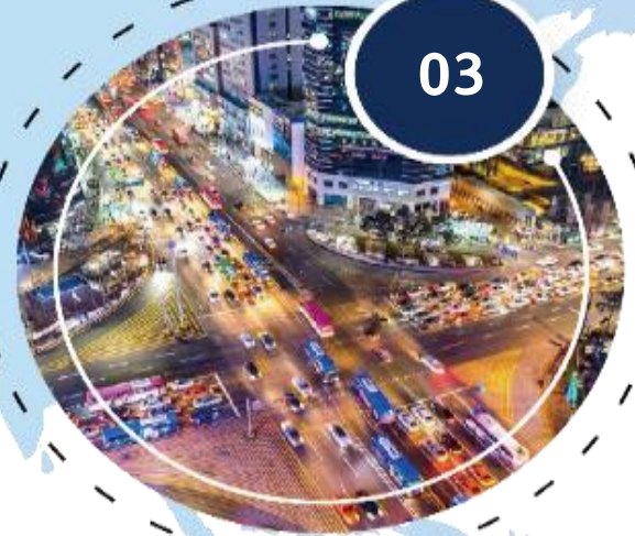
전 세계인들의 희망의 장

코로나19로 인한 팬데믹(pandemic)에 빠져 있는 지금, 위로와 희망의 메시지 전달