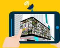
생중계 영상 코엑스 주변 대형미디어 송출 + 기념사진 제공