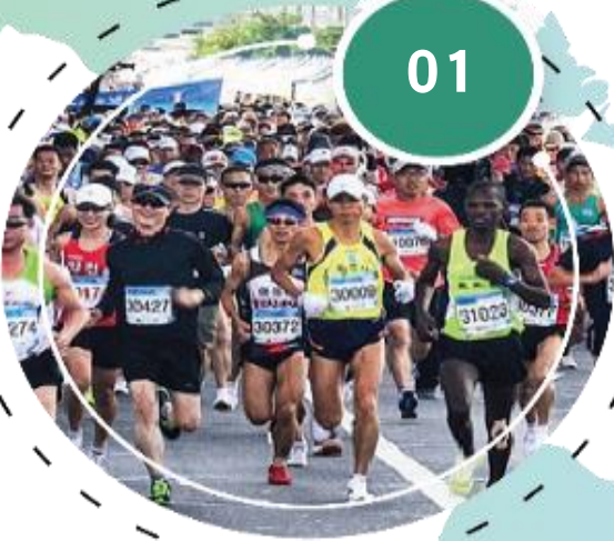
국제 평화 마라톤의 가치 공유