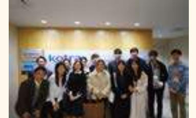
KOTRA IP-Desk in NY