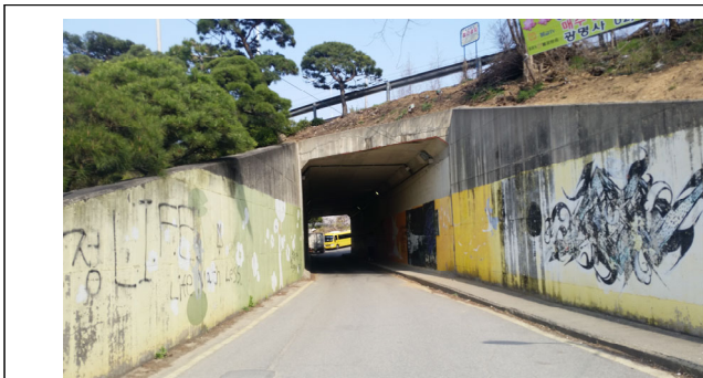
동남로 지하보차도 입구