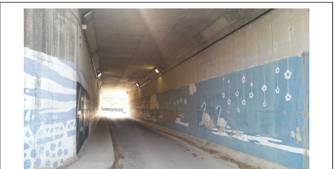
동남로 지하보차도 내부