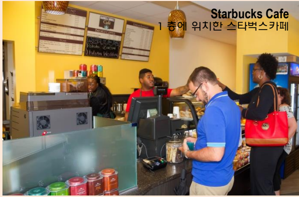
Starbucks Cafe 1 층에 위치한 스타벅스카페