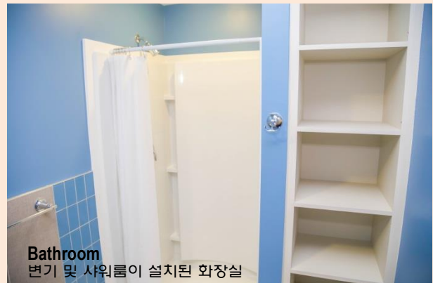
Bathroom 변기 및 샤워룸이 설치된 화장실