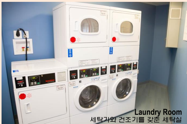
Laundry Room 세탁기와 건조기를 갖춘 세탁실