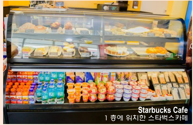
Starbucks Cafe 1 층에 위치한 스타벅스카페