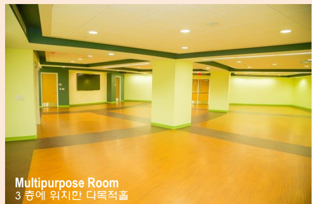
Multipurpose Room 3 층에 위치한 다목적홀