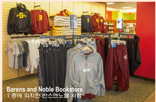
Barens and Noble Bookstore 1 층에 위치한 반스앤노블 서점