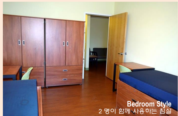
Bedroom Style 2 명이 함께 사용하는 침실