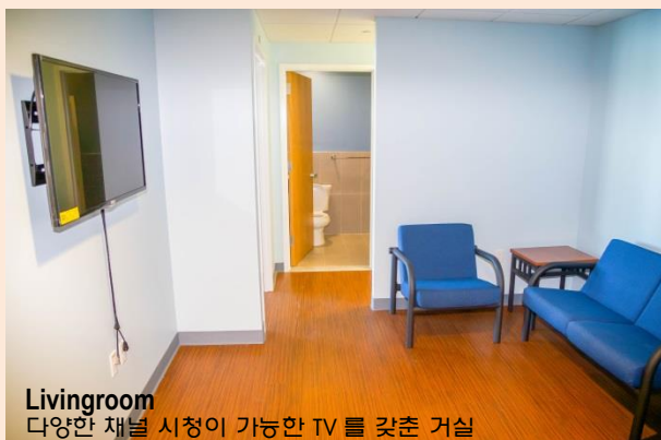
Livingroom 다양한 채널 시청이 가능한 TV 를 갖춘 거실