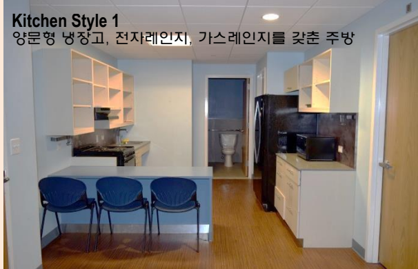
Kitchen Style 1 양문형 냉장고, 전자레인지, 가스레인지를 갖춘 주방