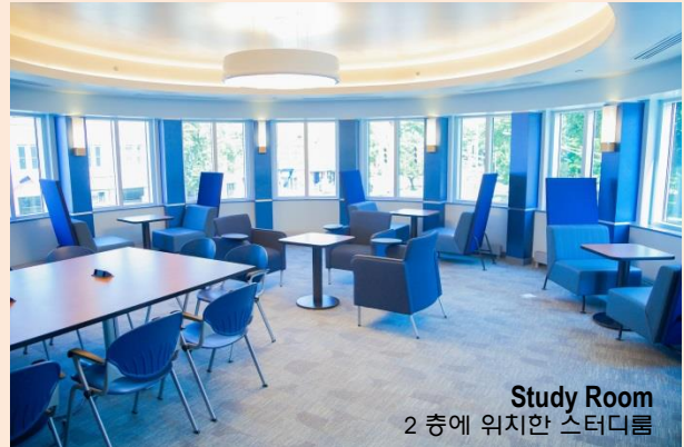
Study Room 2 층에 위치한 스터디룸