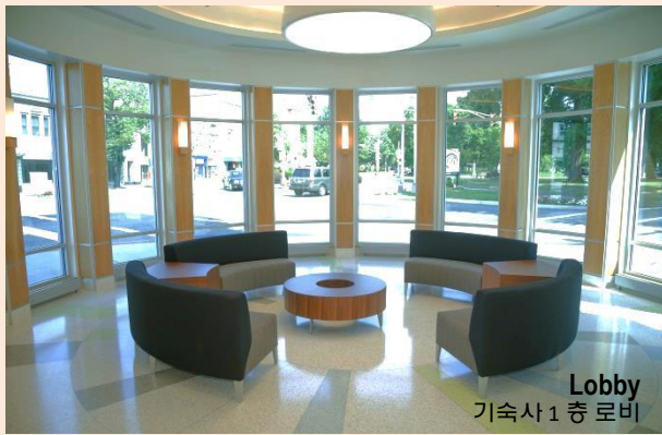
Lobby 기숙사 1 층 로비