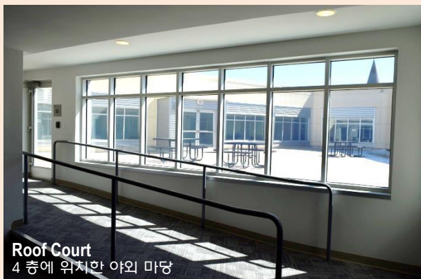
Roof Court 4 층에 위치한 야외 마당