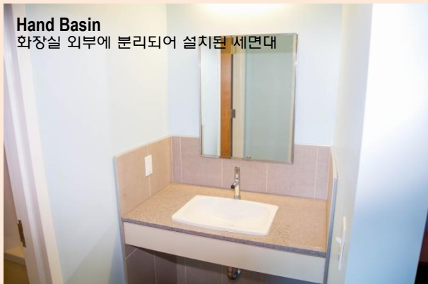
Hand Basin 화장실 외부에 분리되어 설치된 세면대