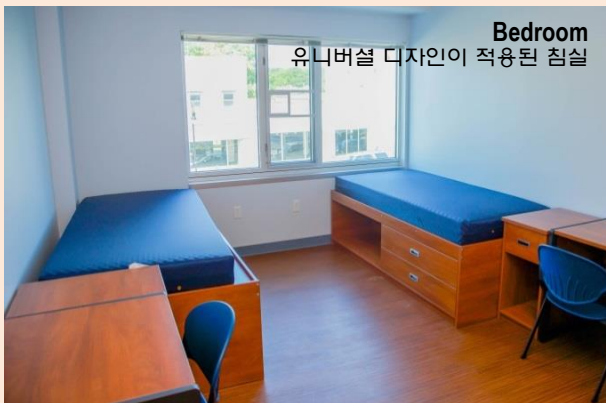
Bedroom 유니버설 디자인이 적용된 침실