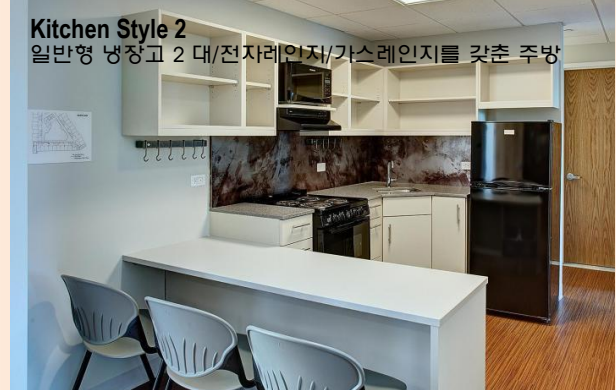
Kitchen Style 2 일반형 냉장고 2 대/전자레인지/가스레인지를 갖춘 주방