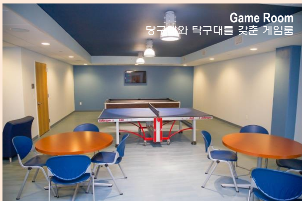
Game Room 당구대와 탁구대를 갖춘 게임룸