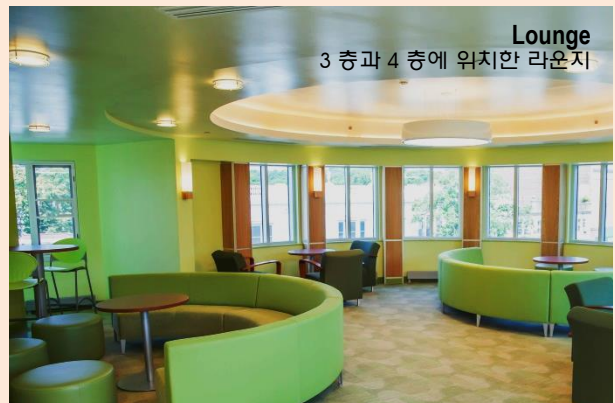
Lounge 3 층과 4 층에 위치한 라운지