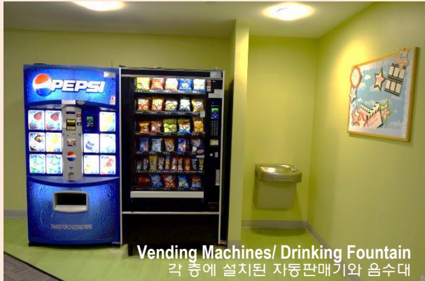
Vending Machines/ Drinking Fountain 각 층에 설치된 자동판매기와 음수대