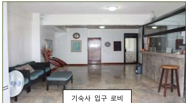
기숙사 입구 로비