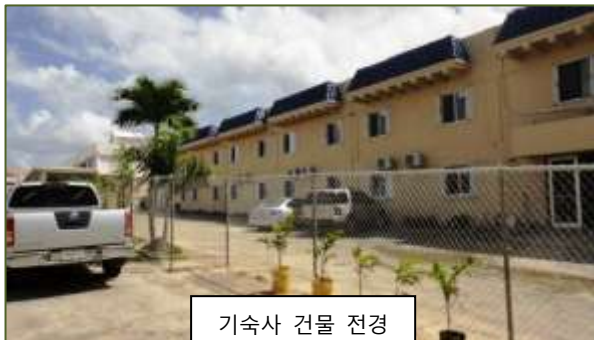
기숙사 건물 전경