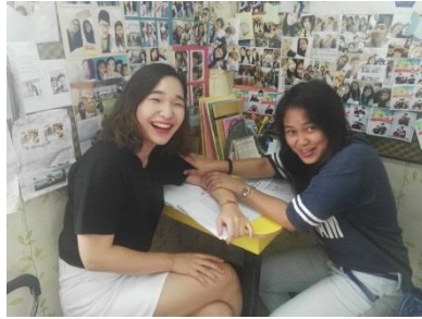
1:1 수업 / 토론 수업 / 전공 수업