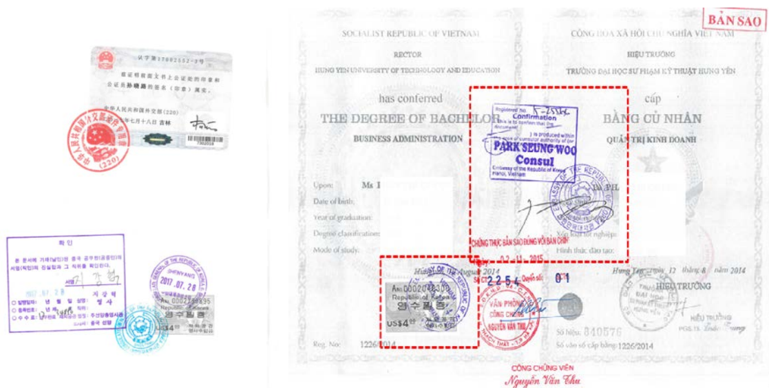
<中国学位证公证件大使馆认证>

大使馆学位证明认证书 Verification of diploma from Korean Embaasy