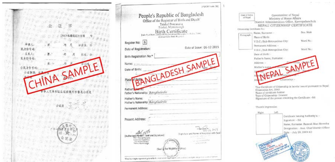
<中国亲属关系证明公证书>

出生证明和家族关系证明 (如果原件不是英文则需要附加翻译件) Birth certificate