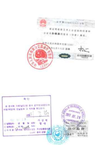
<中国学位证公证件大使馆认证>

大使馆学位证明认证书 Verification of diploma from Korean Embaasy