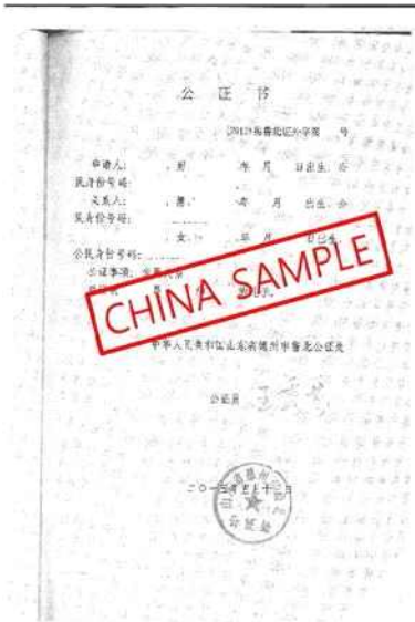
<中国亲属关系证明公证书>

出生证明和家族关系证明 (如果原件不是英文则需要附加翻译件) Birth certificate