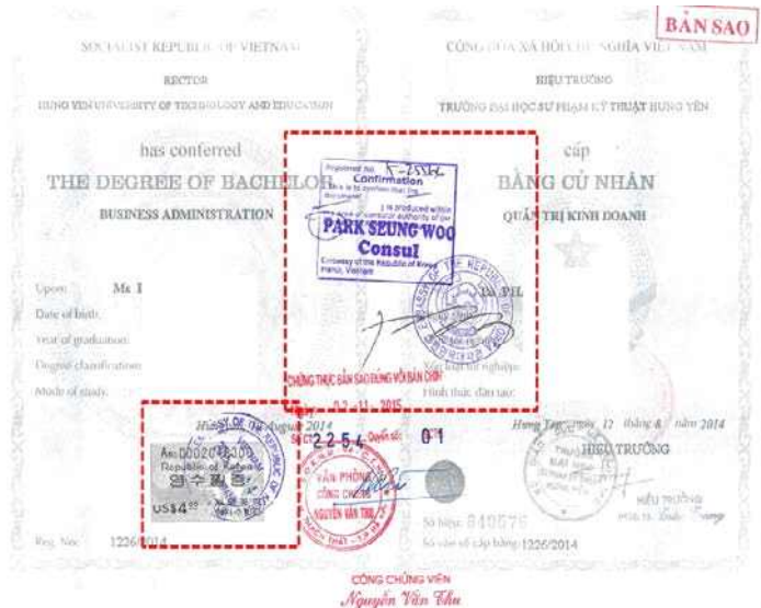
<越南学位证书大使馆认证>