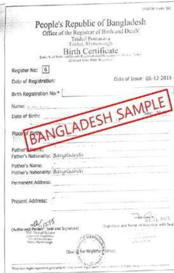
<孟加拉国出生证明书>